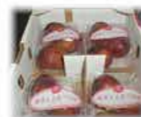
博多とよみつひめ

肥後グリーンは、熊本名産の風味豊かな人気のメロンです。糖度が16度前後と、他のメロンとに比べ、非常に甘みが強く、マスクメロンと比較してもその美味しさはひけをとりません。肥後グリーンメロンは比較的日持ちし、贈り物としても喜んで頂けるとおもいます。