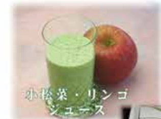
小松菜・リンゴジュース