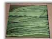
ジャンボいんげん

キャベツには別名「キャベジン」とも呼ばれる「ビタミンU」が含まれています。ビタミンUは胃の粘膜を修復したり、胃潰瘍や十二指腸潰瘍の予防に効果があるとされています。