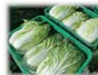
長野県産白菜は夏でも柔らかく高品質