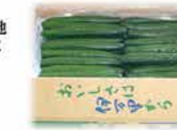
グリーンアスパラ

みょうがはハウスと露地栽培で県内各地で周年生産しており、ハウスみょうがは全国一の出荷量で高知県を代表する特産品の一つとなっています。