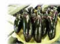
紫小町は小倉南区の小なすをネーミングした特産品です。

高原の冷涼な気候を活かして栽培されるレタスは、6月から9月の夏場が最盛期。長野県の生産量は全国1位を誇ります。