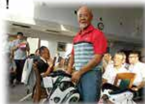
景品を持って記念撮影!